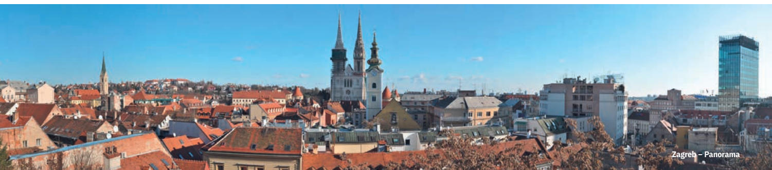
Zagreb – Panorama

Nach dem Frühstück Rückfahrt Teil II – von Rohrdorf zurück zu den Einstiegsorten