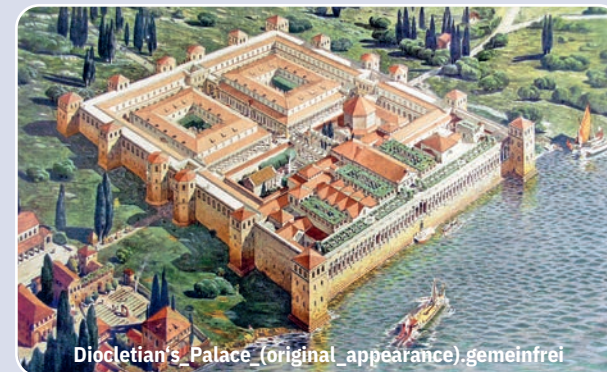
Diocletian's Palace (original appearance). gemeinfrei